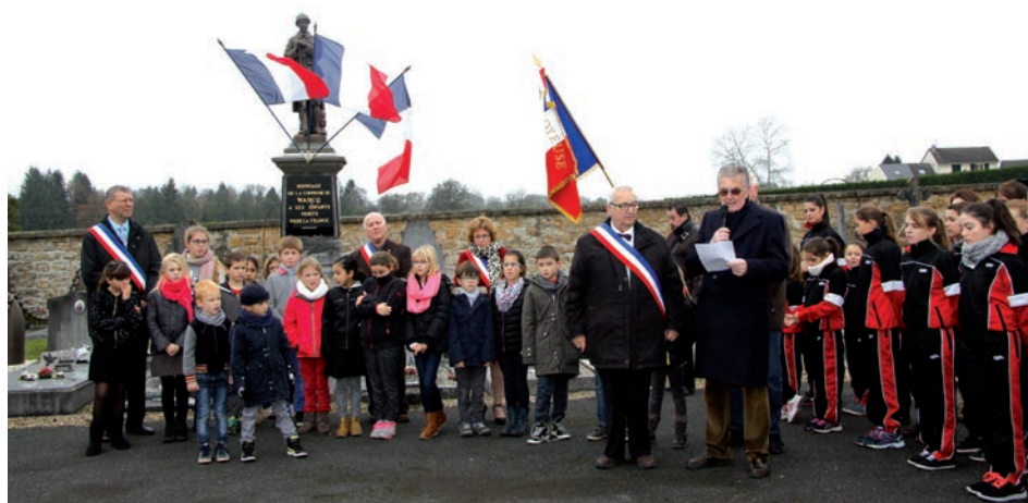
Une nouvelle fois, la jeunesse a été directement associée à la commémoration

événements qui marquèrent notre département pendant 51 mois d'occupation totale, soulignant que les sévices qu'avaient subis les Ardennais à l'époque expliquaient facilement leur exode massif en 1940.