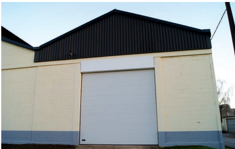
Les ateliers municipaux ont bénéficié de différentes réfections, dont le remplacement des anciennes portes métalliques hors d'usage

Eglise du Centre : L'ancien système de chauffage (dans la sacristie) a été démonté, les murs de la chaufferie nettoyés et le sol remis à niveau. Un nouveau générateur à air chaud sera prochainement installé. Un radian lumineux à gaz a été posé au-dessus de la porte d'entrée.