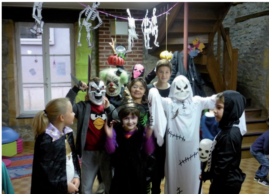
Avant Saint-Nicolas, il y a eu Halloween, déjà prétexte à confectionner déguisements, masques et chapeaux et à jouer à « Coucou fais moi peur » !

Les « NAP » c'est-à-dire les « Nouvelles Activités Péri-scolaires » ont été mises en place à la rentrée de septembre 2014, en conformité avec les orientations ministérielles qui s'imposent à toutes les écoles maternelles et primaires. 59 élèves de primaire y ont été inscrits et 30 en maternelle (l'inscription est facultative et laissée au libre choix des parents). Organisées par les Familles Rurales de Warcq en utilisant au mieux les possibilités et les compétences locales, ces activités hors temps scolaire sont très variées, afin que tous les enfants puissent y trouver de l'intérêt. Ainsi sont proposés des moments d'initiation à la broderie (Françoise Caizergues), au tricot (Paulette Ponsart), aux échecs et à différents sports et jeux d'intérieur ou d'extérieur (Gerardo Godeo), au badminton (Babeth), à toutes sortes de travaux manuels et à la découverte de la nature (Isabelle), à la prévention routière