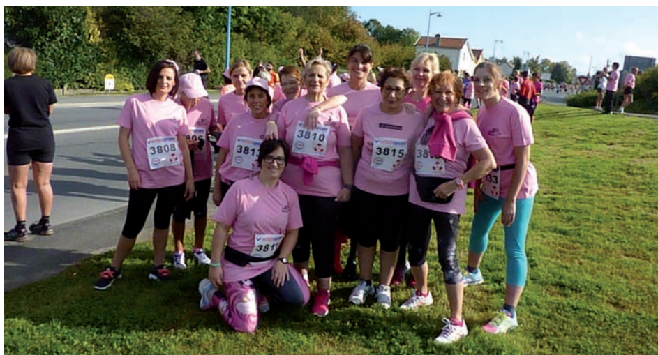
Le groupe de la « course rose » contre le cancer du sein

Mais le Fitness club, c'est aussi du renforcement musculaire, de la zumba, du pilate, de l'aérobixe,