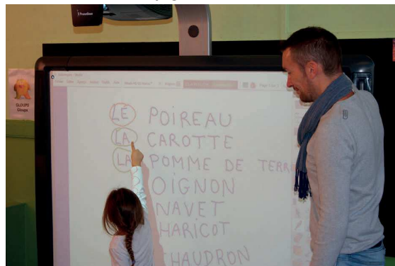
Devant les tableaux interactifs