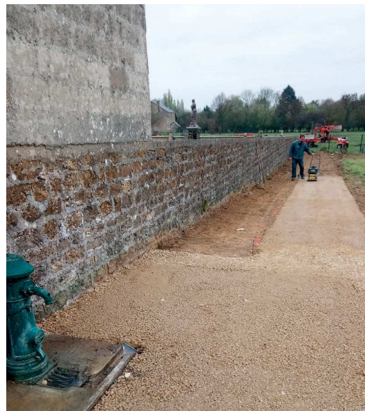
Le futur Colombarium