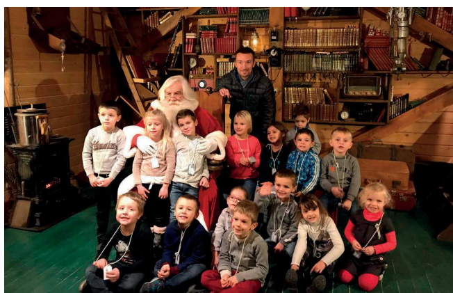
Visite de la Maison du Père Noël à Sept Saulx