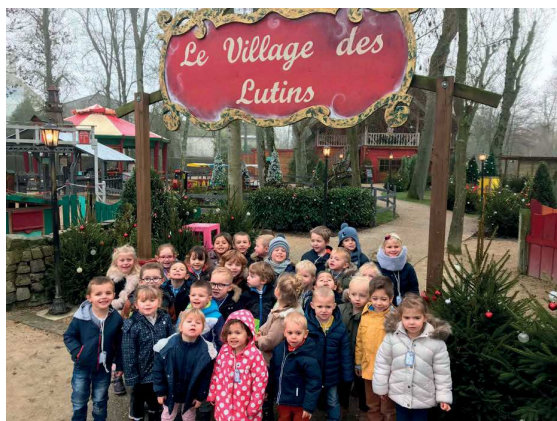
Visite de la Maison du Père Noël à Sept Saulx

Les trois nouveaux enseignants se sont dits très touchés de l'accueil qui leur a été réservé par la commune de Warcq et sont très satisfaits des contacts qu'ils ont avec les parents des élèves. Ils ont déjà organisé, le 11 décembre, la visite de la Maison du Père Noël à Sept Saulx, et ont bien d'autres projets en tête. On sait déjà qu'ils participeront à la fête des "Enfants du Cinéma" en mars/avril, à la Kermesse et au voyage de fin d'année.