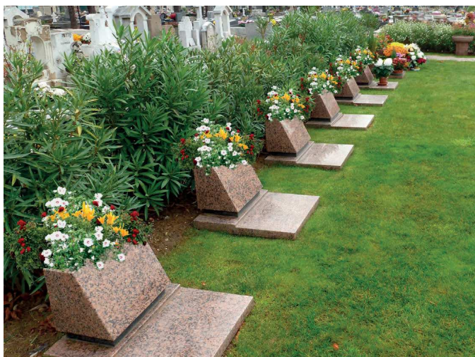
Cavurne «Carré à pupitre»