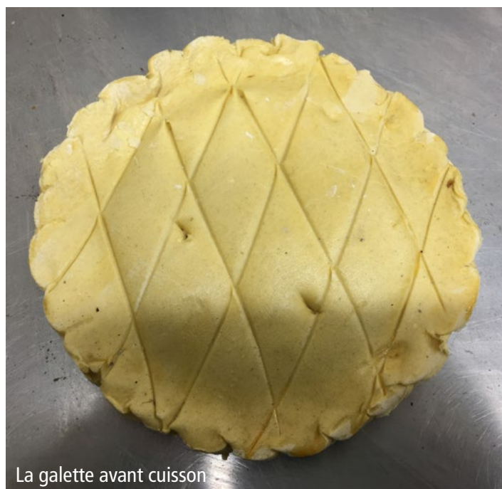
La galette avant cuisson

Après avoir placé la fève, je superpose les deux disques sans oublier de faire trois trous, qu'on appelle "les cheminées", dans la partie supérieure de mon portefeuille. C'est par là que la vapeur va pouvoir s'échapper, ce qui évitera qu'une bulle d'air se forme dans la galette.