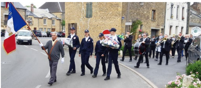
Le départ du cortège du 14 juillet

Et aussi le développement durable, l'écologie, les services publics et le droit. À titre individuel, ils ont tous bénéficié de bilans de santé, d'évaluation de la maîtrise de la langue française et de bilans de compétence numériques.