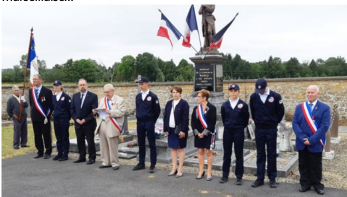
Cérémonie au monument aux morts