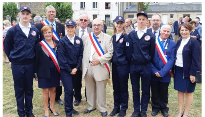
Les quatre jeunes gens en compagnie du Maire et de ses adjoints avec deux Conseillers départementaux et un Vice-président d'Ardenne Métropole.

Ils ont pu découvrir la région, a poursuivi Bernard Pierquin, faire des visites culturelles, participer à la cérémonie de l'appel du 18 juin et à la fête de la musique. Ils ont appris des autres, et aussi d'eux-mêmes, dans un climat d'amitié simple, par le respect et le vivre ensemble en société.